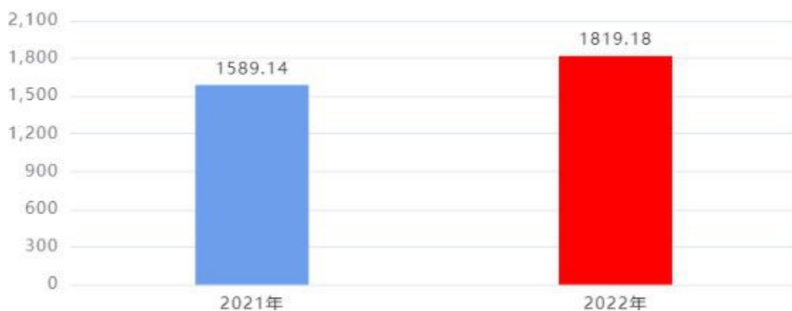
收入、支出决算总计对比图（单位：万元）

2022年度收入总计、支出总计均为1,819.18万元，与上年相比收入总计、支出总计均增加230.04万元，增长14.48%，增长的主要原因是：人员工资因统一调资较上年增加317.03万元；商品服务因厉行勤俭节约支出较上年减少35.16万元；项目经费因厉行勤俭节约支出较上年减少42.57万元。