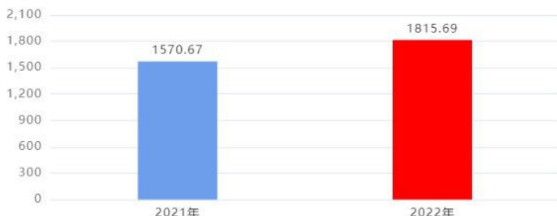
财政拨款支出对比图（单位：万元）

2022年度一般公共预算财政拨款支出年初预算1,567.71万元，支出决算1,815.69万元，完成年初预算的115.82%，占本年支出合计的99.99%。与上年相比，财政拨款支出增加245.02万元，增长15.6%，增长的主要原因是：人员工资因统一调资较上年增加 317.03万元；商品服务因厉行节俭节约支出较上年减少35.16万元；项目经费因厉行节俭节约支出较上年减少42.57万元。