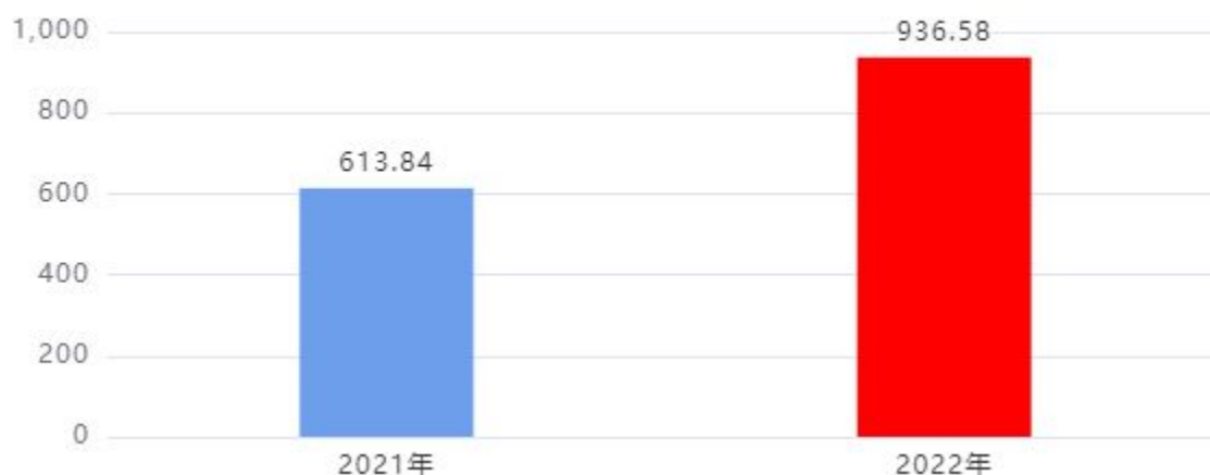
财政拨款收入、支出总计对比图（单位：万元）

2022年度财政拨款收入总计、支出总计均为936.58万元，与上年相比收入总计、支出总计均增加322.74万元，增长52.58%，增长的主要原因是：人员经费、专项业务经费增加。