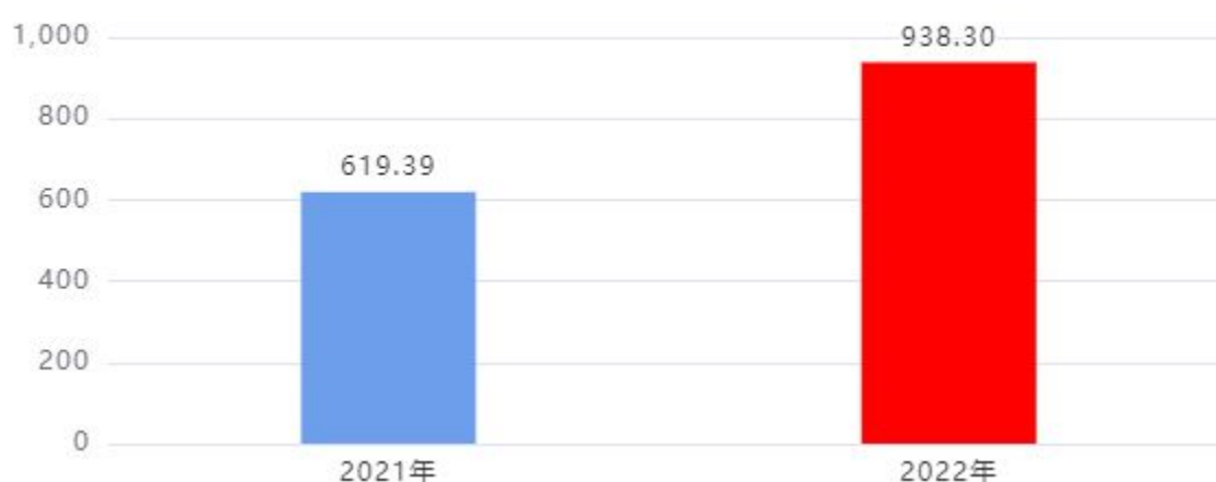
收入、支出决算总计对比图（单位：万元）

2022年度收入总计、支出总计均为938.3万元，与上年相比收入总计、支出总计均增加318.91万元，增长51.49%，增长的主要原因是：人员经费、专项业务经费增加。