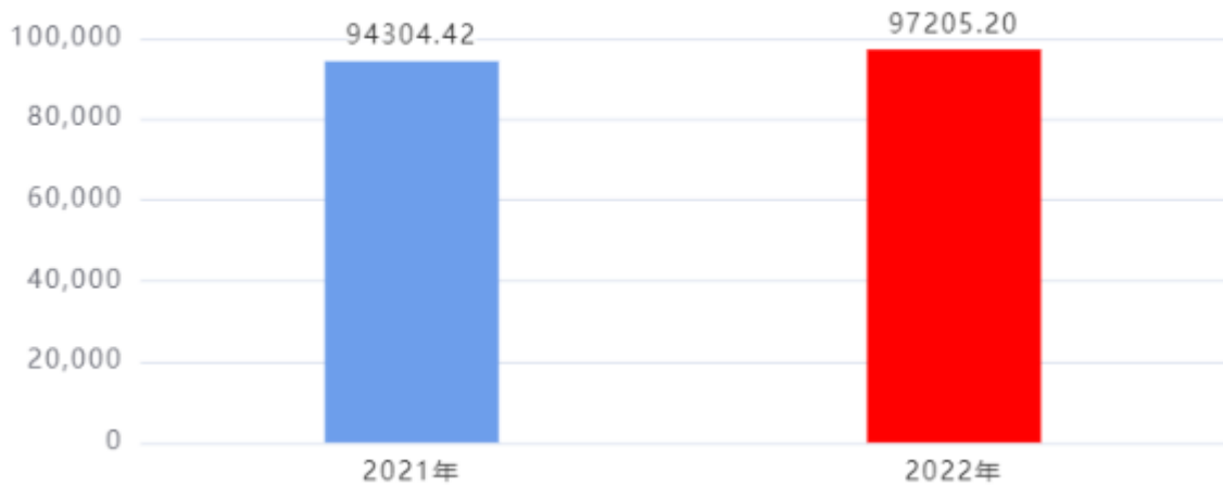
财政拨款收入、支出总计对比图（单位：万元）