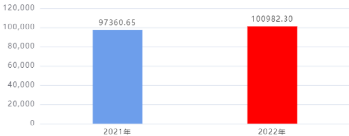
收入、支出决算总计对比图（单位：万元）

2022年度收入总计、支出总计均为100,982.3万元，与上年相比收入总计、支出总计均增加3,621.65万元，增长3.72%，增长的主要原因是：2022年起，国家毒品实验室陕西分中心部门预算列入省公安厅管理，年初预算及年内专项经费增加较多。