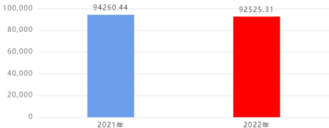
财政拨款支出对比图（单位：万元）

2022年度一般公共预算财政拨款支出年初预算63,595.75万元，支出决算92,525.31万元，完成年初预算的145.49%，占本年支出合计的96.25%。与上年相比，财政拨款支出减少1,735.13万元，下降1.84%，下降的主要原因是：因受疫情影响，省公安厅部分专项业务经费执行率较低。