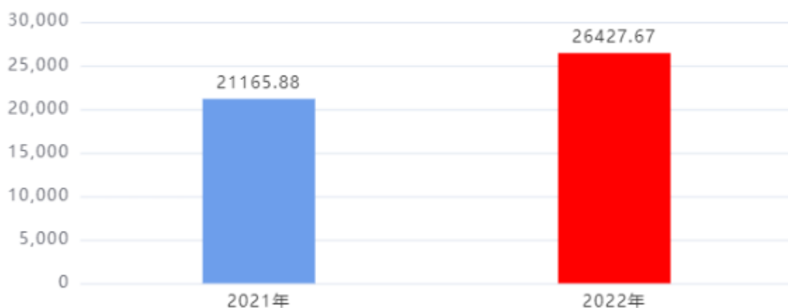
财政拨款支出对比图 (单位: 万元)

2022年度一般公共预算财政拨款支出年初预算19,477.31万元, 支出决算26,427.67万元, 完成年初预算的135.68%, 占本年支出合计的84.46%。与上年相比, 财政拨款支出增加5,261.79万元, 增长24.86%, 增长的主要原因是: 人员经费增加3,634.90万元, 公用经费减少535.89万元, 项目经费增加2,162.78万元。