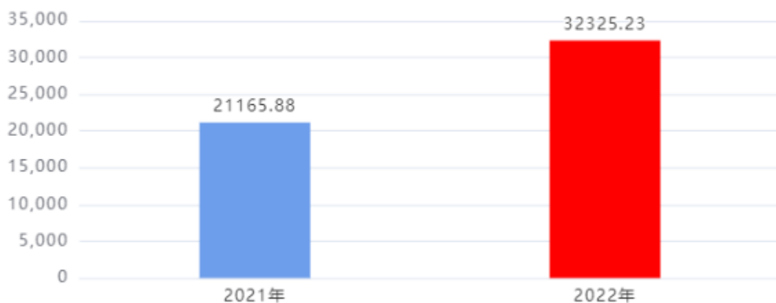
财政拨款收入、支出总计对比图 (单位: 万元)

校区建设) 资金8,000万元, 主体班培训经费增加1,000万元, 追加住房货币化补贴、一次性抚恤金、调整2021、2022年度考核奖及年基础绩效奖、工资清算等增加2,159.35万元。