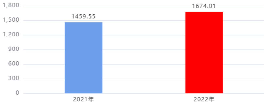
财政拨款支出对比图（单位：万元）

2022年度一般公共预算财政拨款支出年初预算1,951.18万元，支出决算1,674.01万元，完成年初预算的85.79%，占本年支出合计的99.98%。与上年相比，财政拨款支出增加214.46万元，增长14.69%，增长的主要原因是：在职人员增加，加之工资政策调整，人员工资和社保缴费等人员经费相应增加。