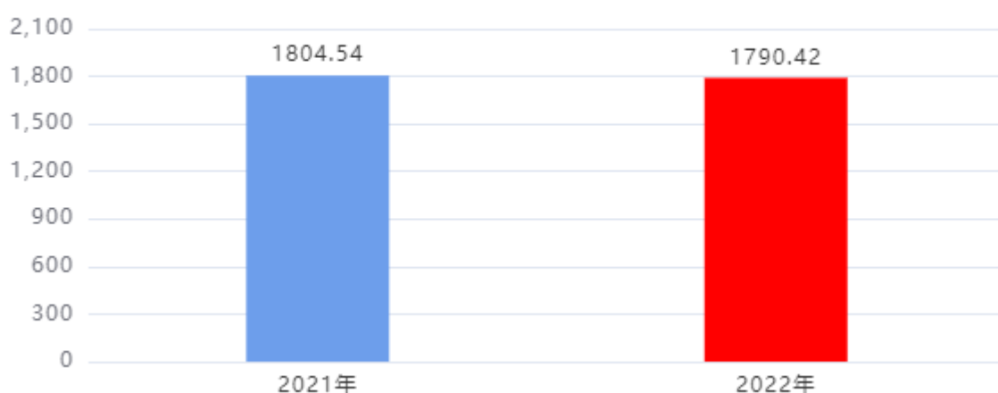
收入、支出决算总计对比图（单位：万元）

2022年度收入总计、支出总计均为1,790.42万元，与上年相比收入总计、支出总计均减少14.12万元，下降0.78%，下降的主要原因是：专项业务事项减少，专项业务经费收支相应减少。