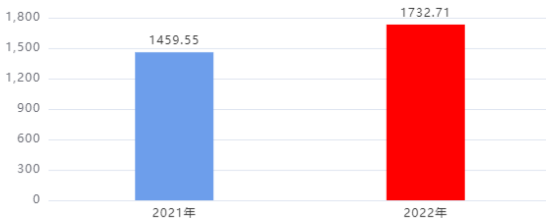
财政拨款收入、支出总计对比图 (单位：万元)

2022年度财政拨款收入总计、支出总计均为1,732.71万元，与上年相比收入总计、支出总计均增加273.16万元，增长18.72%，增长的主要原因是：在职人员增加，加之工资政策调整，人员工资和社保缴费等人员经费相应增加。